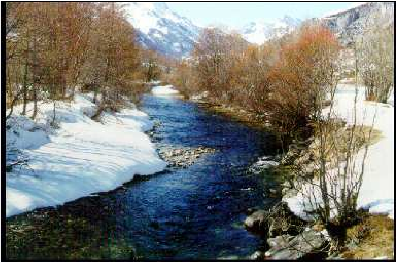
la Clarée, haute vallée de la Durance